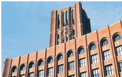
BALD MIT MUSEUM? | Das Ullsteinhaus in Tempelhof

dringend Sponsoren, Mäzene und Unterstützer, vor allem aus der Verlags- und Medienbranche.