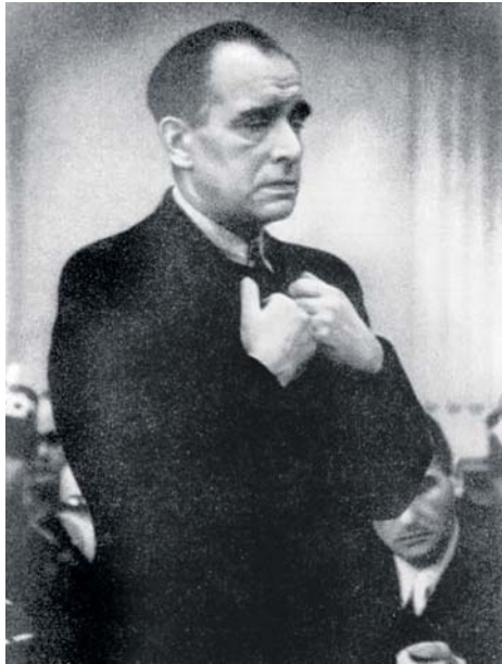
JULIUS LEBER | Aufgenommen während des Prozesses vor dem »Volksgerichtshof« Berlin, 1944

Am 23. März 1933 wurde er auf der ersten Sitzung des