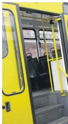
DIE TRAM | Einsteigen, bitte!?

In der Haupt- und Potsdamer Straße ist die Tram als Verkehrsmittel ungeeignet und viel zu gefährlich.