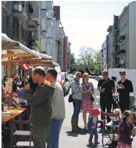
ENGAGIERT | Anwohner/innen und Gewerbetreibende trafen sich im Frühjahr zu einem ersten Straßenfest.

Fabian Lenzen, Tel. 781 51 02, f.lenzen@kluth-bestattungen.de Steffi Brüning, Tel. 782 19 71, info@blumen-stoecklein.de