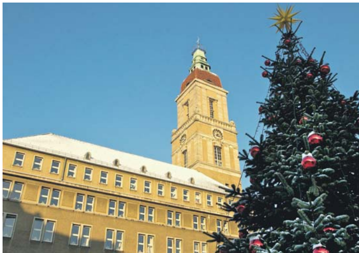
RATHAUS FRIEDENAU | Das Verwaltungsgebäude ist auch prägende Kulisse für den Breslauer Platz