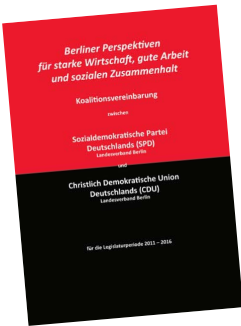
UNTERSCHRIEBEN | Der rot-schwarze Koalitionsvertrag

Auch die mit der CDU aufgenommenen Verhandlungen auf Landesebene waren nicht einfach. Man musste sich erst aneinander gewöhnen. Alle Politikbereiche mussten durchgearbeitet und festgelegt werden. Nach sechs intensiven Wochen stand ein Ergebnis fest, mit dem die SPD gut leben kann, denn der rot-schwarze Koalitionsvertrag enthält viele Elemente